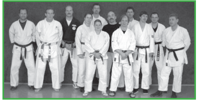
Jugend-Übungsleiterschulung in Lindlar