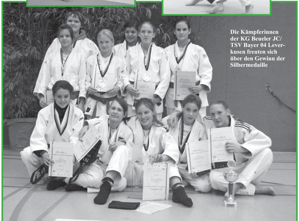
Die Kämpferinnen der KG Beueler JC/ TSV Bayer 04 Leverkusen freuten sich über den Gewinn der Silbermedaille