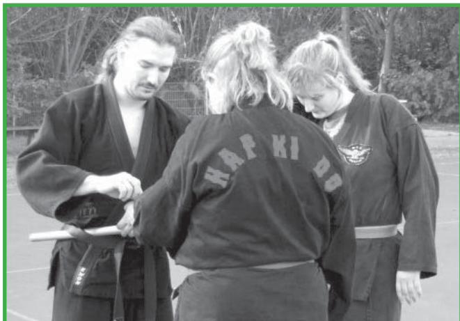
Im Dezember gibt es eine Fortsetzung dieses Waffenlehrgangs

1953 wechselte ich zum Judo-sport über und fuhr zweimal wöchentlich mit dem Fahrrad nach Duisburg-Hamborn, um bei Hamborn 07 unter der Leitung des so früh verstorbenen Walter Schombert, 4. Dan Judo, Ex-Europameister und mehrfacher Deutscher Meister im Schwergewicht, zu trainieren. 1955 unterrichtete ich eine Volksschulklasse in Oberhausen-Altstadt und gründete gleichzeitig die Judo- und Jiu-Jitsu-Abteilung 1887 Altstadt. Trainer Schombert unterstützte