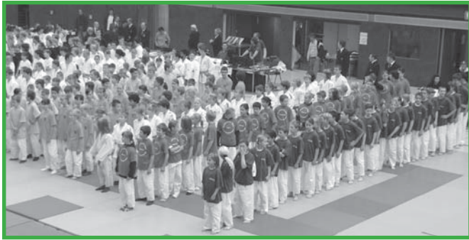
Mannschaftskämpfe gehören zu den Highlights im Wettkampfkalender

und im nächsten Jahr in Recklinghausen wieder antreten.