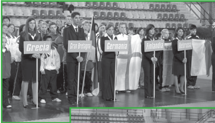
Aufstellung der Teams aus 15 Nationen im Rahmen der Eröffnungsveranstaltung

Wushu-Verband Nordrhein-Westfalen e.V. Geschäftsstelle Manfred Eckert Melatenweg 144 46459 Rees Tel.: 0 28 51 / 5 84 90 Fax: 0 28 51 / 29 21 E-Mail: praesident@wushudwf.de Internet: www.wvwn.de