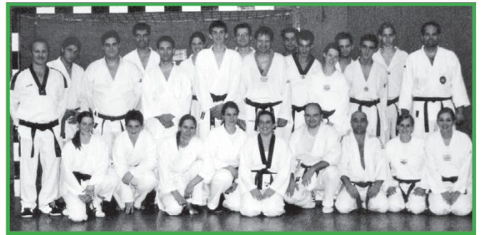
Teilnehmer des 2. Landeslehrgangs in Herne