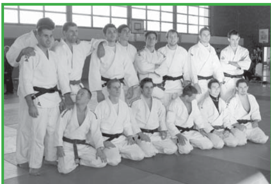
Aufsteiger in die 2. Bundesliga der Männer: Die Mannschaft des Beueler JC