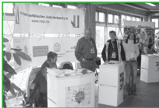
Im Foyer der Unihalle in Wuppertal konnten die Infostände des Nordrhein-Westfälischen Judo-Verbandes (Foto), des Deutschen Judo-Bundes und des LandesSportBundes Nordrhein-Westfalen besucht werden.