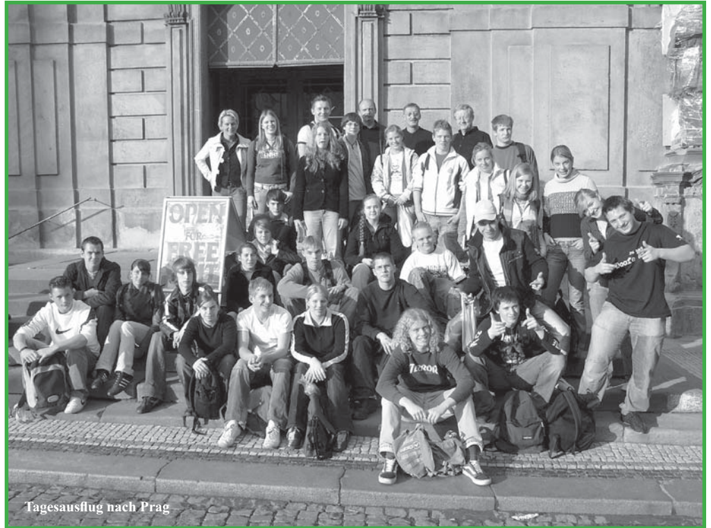
Tagesausflug nach Prag