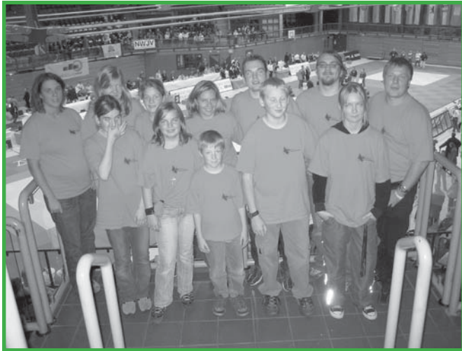
Die Judokas vom SC Huckarde-Rahm in der Wuppertaler Unihalle