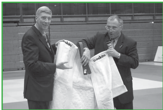
Der Innenminister und Sportminister des Landes Nordrhein-Westfalen Ingo Wolf erhielt von DJB-Präsident Peter Frese einen Judo-Anzug mit blauem Gürtel. Die Söhne des Ministers betreiben auch Judo.