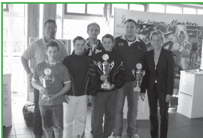
Im Rahmen der DEM in Wuppertal wurden die siegreichen Mannschaften der Regionalliga geehrt

1. und 2. Bundesliga Nord Männer 1. KT: Sa, 25.03., 2. KT: Sa, 01.04., 3. KT: Sa, 03.06., 4. KT: Sa, 21.10., 5. KT: Sa, 17.06., 6. KT: Sa, 24.06., 7. KT: Sa, 26.08., 8. KT: Sa, 07.10., (Viertelfinale), 9. KT: Sa, 28.10. (Endrunde)