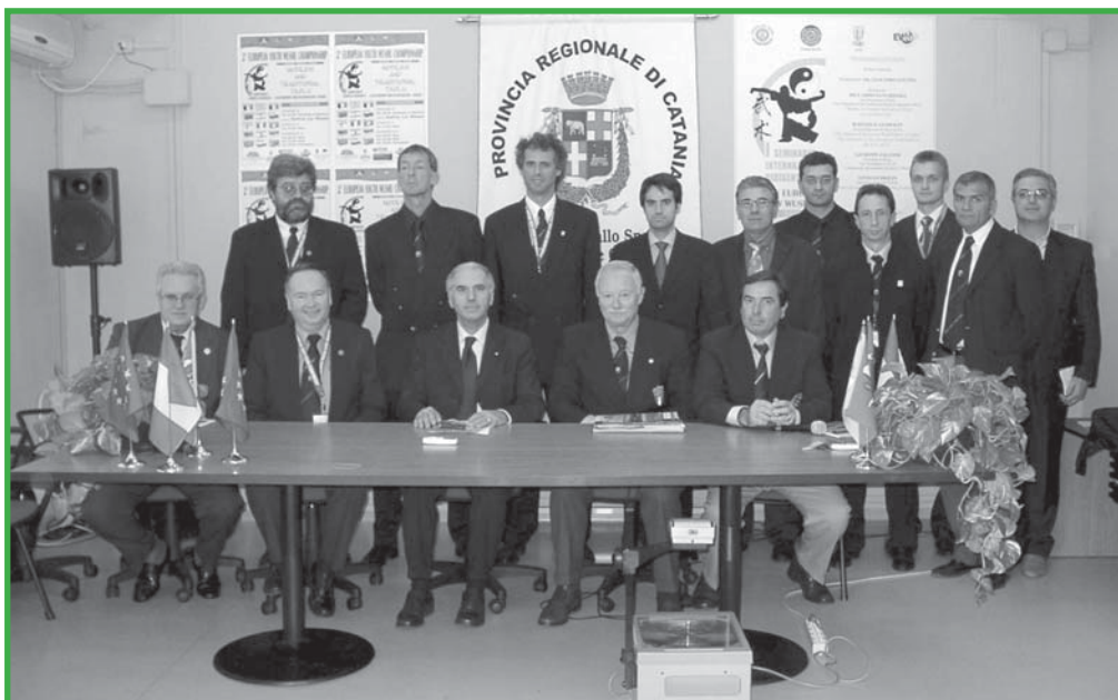
Meeting der EWUF, u. a. mit den Präsidenten der teilnehmenden Nationen

Ergebnisse des deutschen Jugend-Nationalteams: