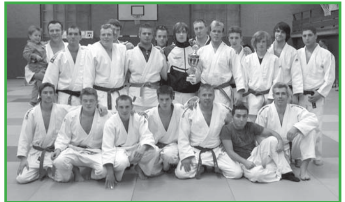
Auch hier „startete“ ein Aufsteiger in der höheren Liga direkt durch. Erst der letzte Kampftag in der Oberliga der Männer entschied über den Aufstieg des VfL Hüls in die Regionalliga

Auch der Abstiegskampf wurde erst am letzten Kampftag in Brühl ermittelt. Durch eine 5:2-Niederlage gegen die gastgebende Mannschaft muss der Brander TV den Weg zurück in die Landesliga antreten.