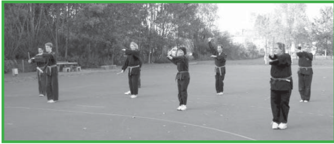
Die Teilnehmer des Waffenlehrgangs nutzten das schöne Wetter für ein Training im Freien