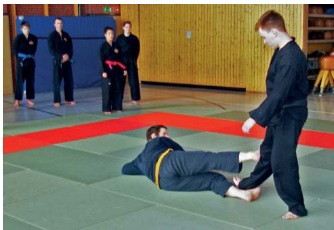
Fußtritte aus der Bodenlage

te weiter mit Fall- sowie Reaktionsübungen, welche für die Mehrheit der Übenden neu waren. Thema seiner ersten Lehrgangseinheit waren dann die Fußtritte aus der Bodenlage.