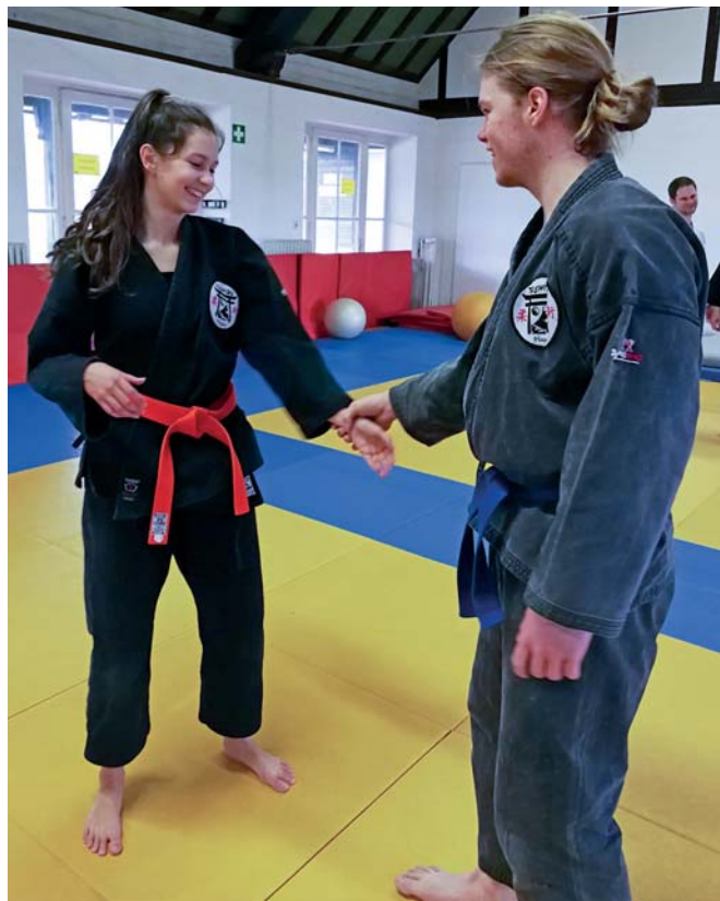
Kontakt am Handgelenk

Anschließend wurden zunächst in einem kurzen Theorieteil die Besonderheiten bei Körperangriffen erarbeitet. Im Idealfall kommt es gar nicht zu einem Körperangriff. Wenn der Angreifer so nah ist, dass Angriffe wie Umklammerung, Würgen, Revers fassen, etc. möglich sind, war der Verteidiger im Vorfeld meist nicht aufmerksam genug, um die drohende Gefahr zu erkennen und den Angreifer auf Distanz zu halten. Ein Angreifer, der auf den Einsatz von Waffen verzichtet, besitzt in der Regel eine körperliche Überlegenheit in Form von Kraft und/oder Größe bzw. Gewicht. Als weitere Schwierigkeit sind die eingeschränkte Bewegungsfreiheit und kurze Distanz zum Angreifer bei der Verteidigung zu berücksichtigen.