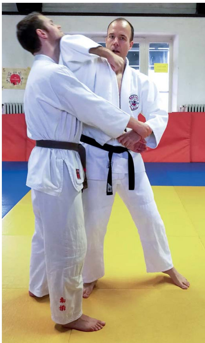
Schocken und Rausgehen